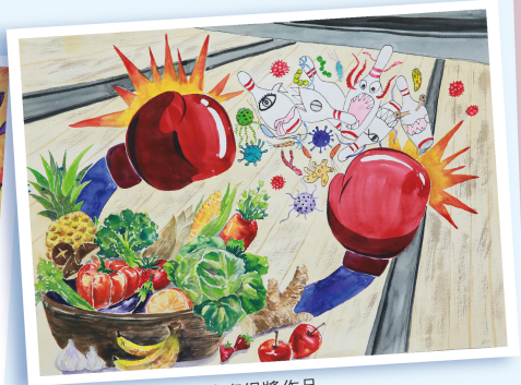
第九屆愛與關懷繪畫比賽得獎作品 繪者:王柏勳