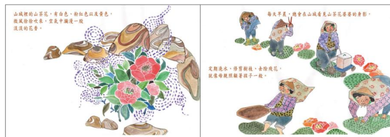
※範例作品：教育部反毒繪本—山茶花婆婆/洪孟真、呂舒婷